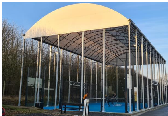
Odense Eventyr Padel Center

Den overdækkede bane medfører de samme overvejelser omkring højde til loftet som indendørs baner.