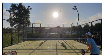
Tåsinge Tennis og Padel Klub

Vores erfaring er at padelbanen bliver brugt i timerne fra kl. 6 til 23 alle dage, så solens fulde bane over himlen er i spil.